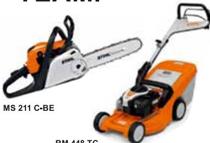
MS 211 C-BE